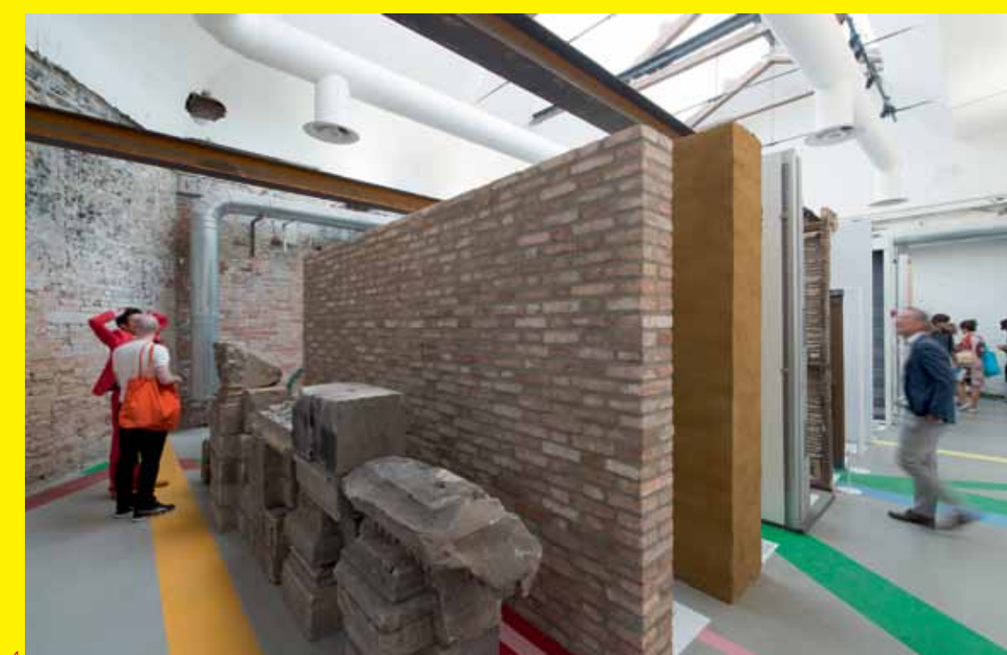
6 Deur De deur is een traditioneel element dat zich heeft ontwikkeld tot een gedematerialiseerde zone waarin de overgang van het ene in het andere gebied wordt geregeld door metaaldetectoren, kaartlezers en bodyscanners. Naast mock-ups van een serie deuren uit de hele wereld, staat in deze installatie het Hochosterwitz kasteel in Oostenrijk, waarvan iedere poort is uitgerust met tal van veiligheidsmaatregelen, tegenover het moderne vliegveld waar reizigers een serie veiligheidsprocedures moeten doorlopen.